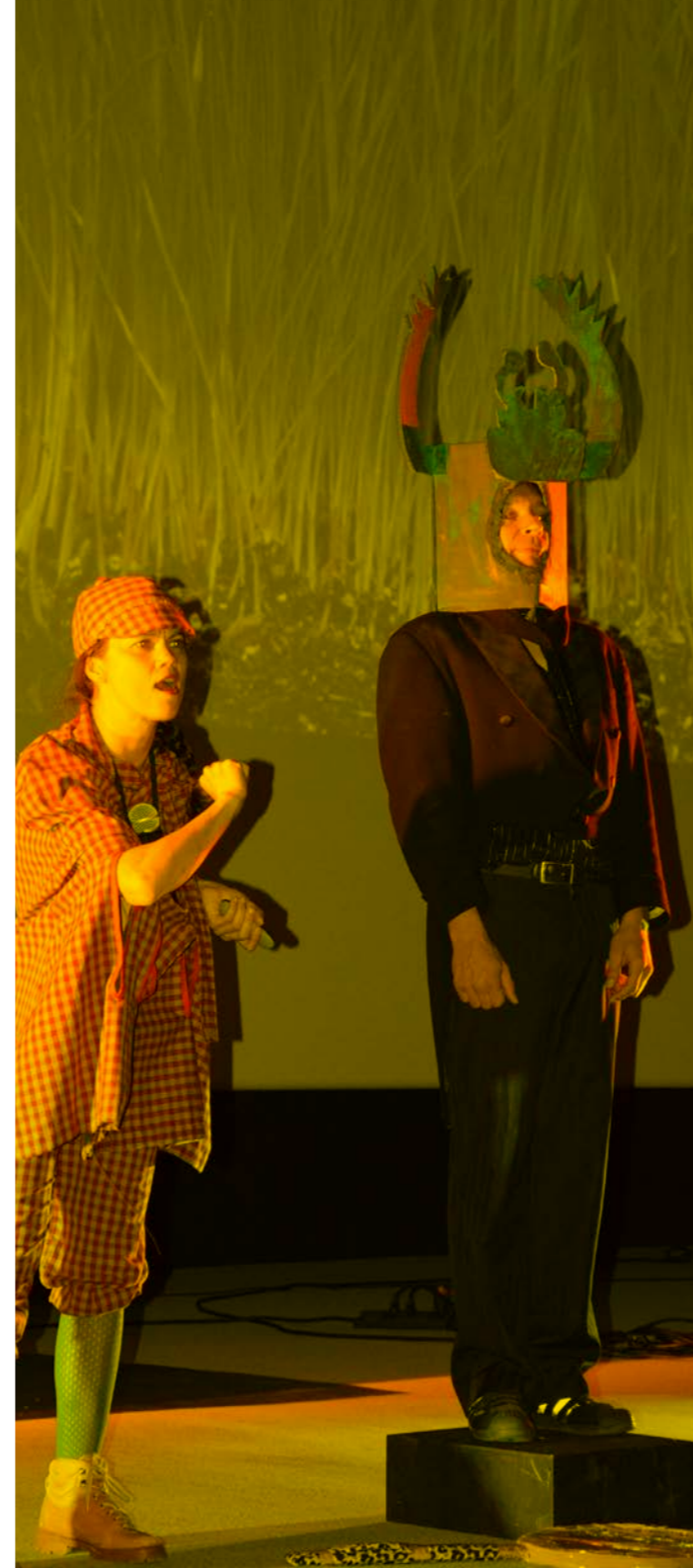
Cie Groenland Paradoxe